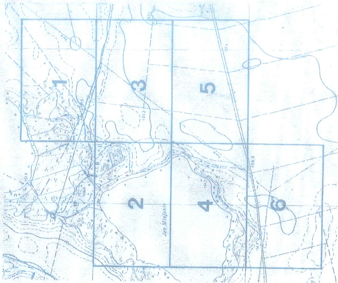
SCHEMAT ROZMIESZCZENIA RYSUNKÓW PLANU

URZĄD MIEJSKI ul. Partyzantów 1 21-118 Ostrow Lubelski